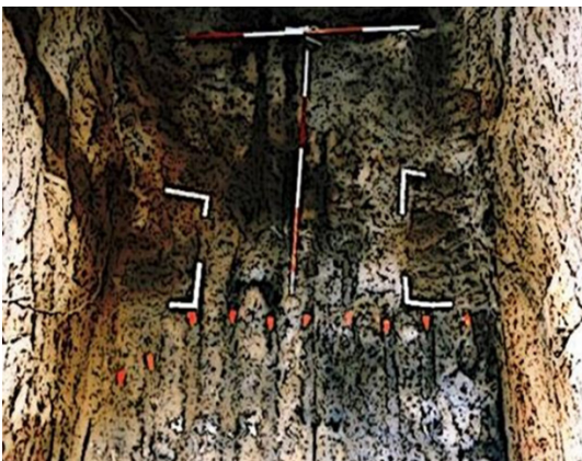
Illustration showing the tool-marks (furrows marked with red arrows) created by the teeth of a mechanical excavator that have left impressions in the floor (center foreground) and walls of an excavated mass grave.

« DOCUMENTATION MUST BE DONE TO A STANDARD THAT WILL MAKE IT POSSIBLE FOR A TECHNICAL EXPERT TO RECONSTRUCT, AT A LATER DATE, WHAT HAS BEEN DONE, TO INTERPRET THE FACTS OF THE CASE, AND TO ARRIVE AT THE SAME CONCLUSION. EQUALLY IMPORTANT, THIS INFORMATION MUST BE COMMUNICATED IN AN EFFECTIVE AND TRANSPARENT MANNER TO FAMILY MEMBERS, OFFICERS OF THE COURT OR JUSTICE MECHANISM, AND THE GENERAL PUBLIC »