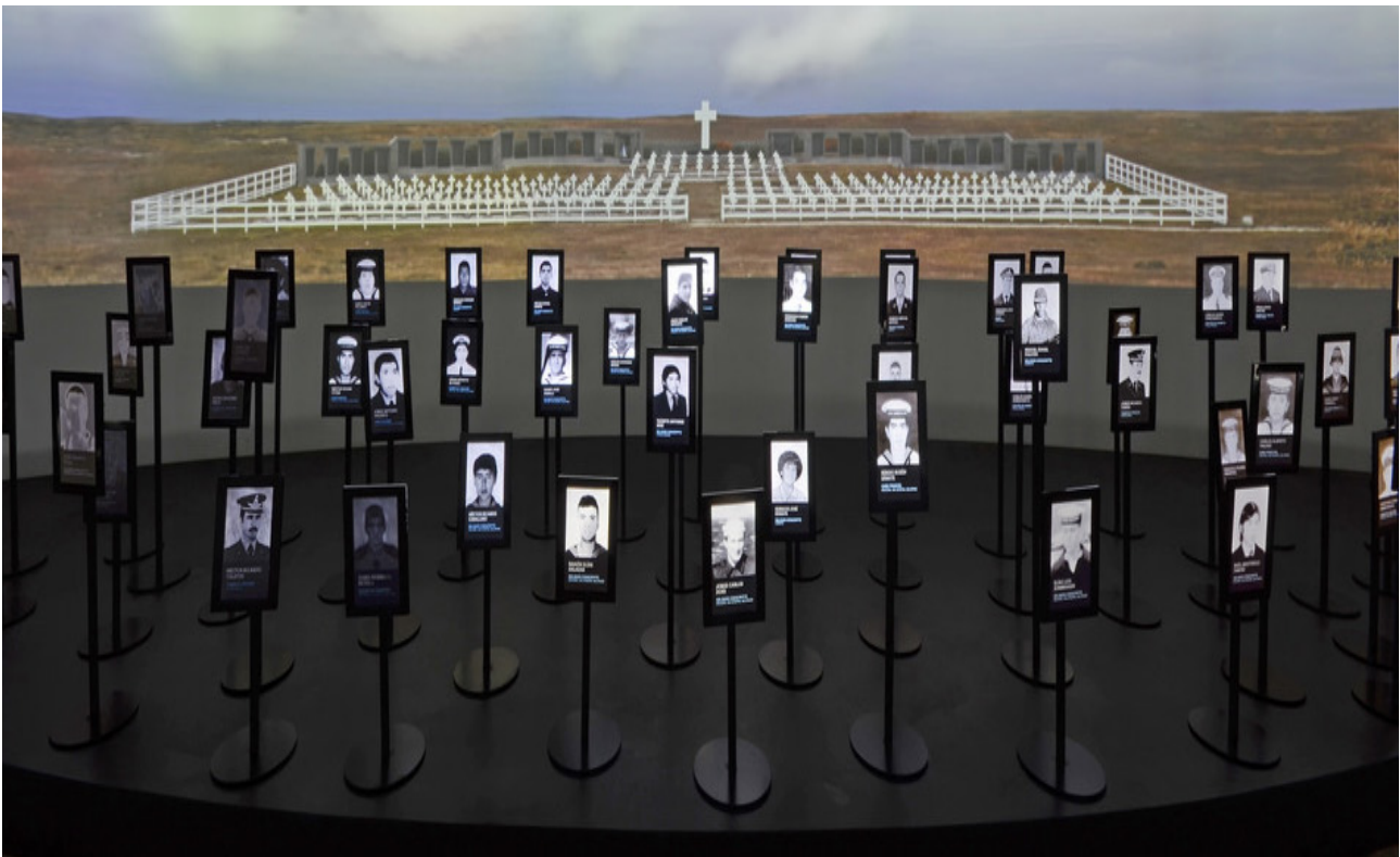
Photo of the Museum Malvinas e Islas del Pacifico Sur. The Argentine team of forensic anthropology allowed the identification of the soldtas buried in the Malvinas Islands.

The Argentine Forensic Anthropology Team works hard to meet the needs of the families and advance the quest for truth. It also deploys groups of specialists in Africa, Southeast Asia, and the Middle East, to train locals in the use of forensic materials. Transitional justice mechanisms are important to help societies across the globe move from a state of war to a state of peace. Ending human rights violations, such as enforced disappearances, requires the involvement of experts who use a variety of methods and procedures coming from different disciplines.