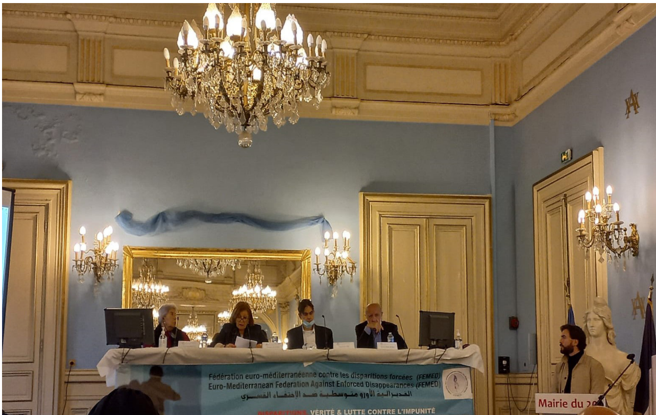
Conference of October 31 organized by the FEMED, in Paris, on forensic anthropology in the service of transitional justice

«FORENSIC ANTHROPOLOGY HAS MADE IT POSSIBLE ON MANY OCCASIONS TO JUDGE INDIVIDUALS THROUGH THE COLLECTION OF SCIENTIFIC DATA.»