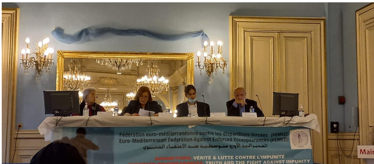
Conférence du 31 octobre organisée par la FEMED, à Paris, portant sur l'anthropologie médico-légale au service de la justice transitionnelle